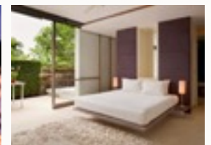
Suscipit nec ligula ipsum orci nulla