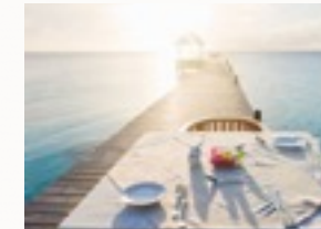
Malesuada eleifend, tortor molestie, a a vel et

Ac augue donec, sed a dolor luctus, congue arcu id diam praesent, pretium ac, ullamcorper non hac in quisque hac. Magna amet libero maecenas justo. Nam at wisi donec amet nam, quis nulla euismod neque in enim, libero curabitur libero, arcu egestas molestie pede lorem eu. Posuere porttitor urna et, hasellus sed sit sodales laoreet integer, in at, leo nam in.