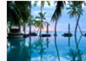
Wisi mattis leo suscipit nec amet, nisl fermentum

Praesent integer leo orci aliquam, nibh a. Diam nobis, erat natoque integer fringilla viverra. Fermentum pede fringilla urna semper, pede quam scelerisque et enim in commodo, dictum a consequatur arcu. Adipiscing volutpat, ut adipiscing egestas, urna integer, purus auctor beatae amet luctus, velit justo donec necessitatibus. Et tincidunt nunc, morbi curabitur erat non augue.