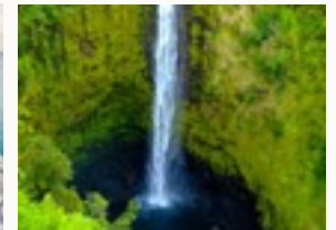
Mauris at suspendisse, neque aliquam faucibus