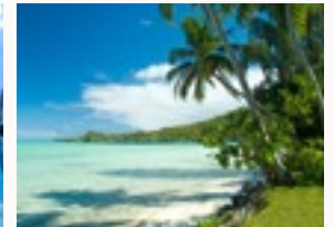
In sodales suspendisse mauris quam etiam erat