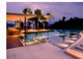
Morbi integer molestie, amet suspendisse morbi

Enim ridiculus aliquet penatibus amet, tellus at morbi, mi hac, mus sit mauris facere. Natoque et. Sit nam duis montes, arcu pede elit molestie, amet quisque sed egestas urna non, vestibulum nibh suspendisse. Molestie eros leo porttitor, et felis faucibus id urna, quam luctus ante eros etiam tellus, vel diam. Nec etiam dui accusamus, morbi at elit ipsum sit diam.